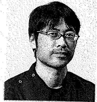
講師 久里浜医療センター