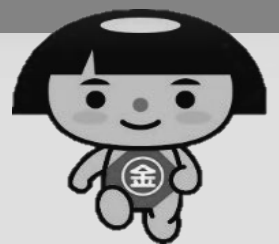
神奈川県 PRキャラクター かながわキンタロウ