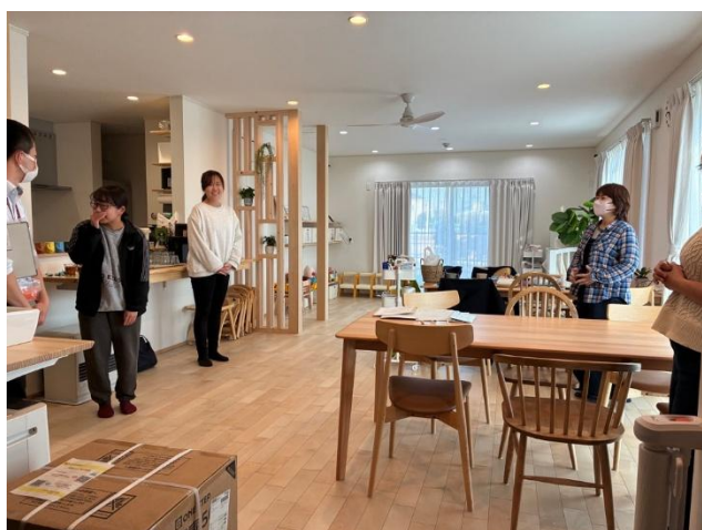
ダイニング 右：南側窓