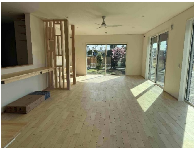
ダイニング 右：南側窓