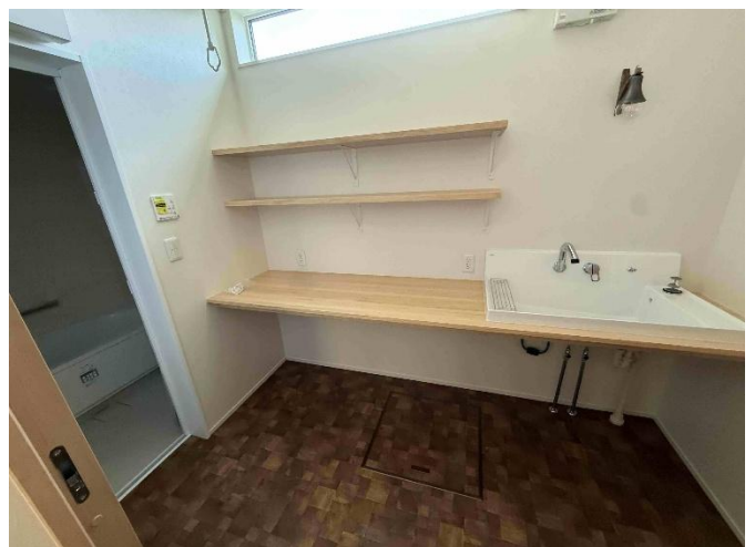
洗面脱衣室 左：風呂場へのドア