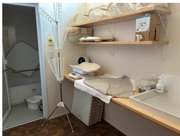
洗面脱衣室 左：風呂場へのドア