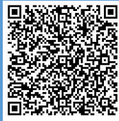
電子申請フォーム