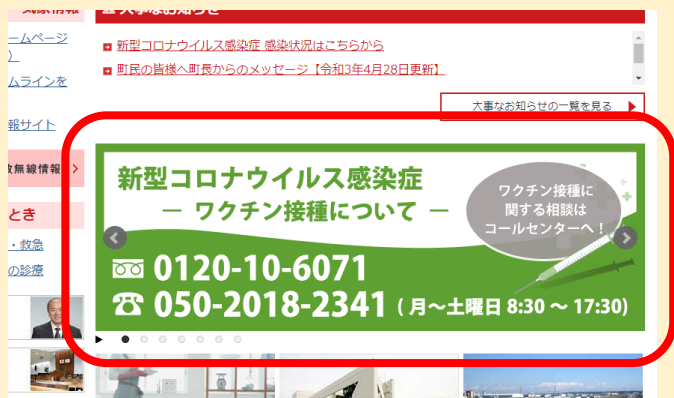
町ホームページ トップページのパナーから