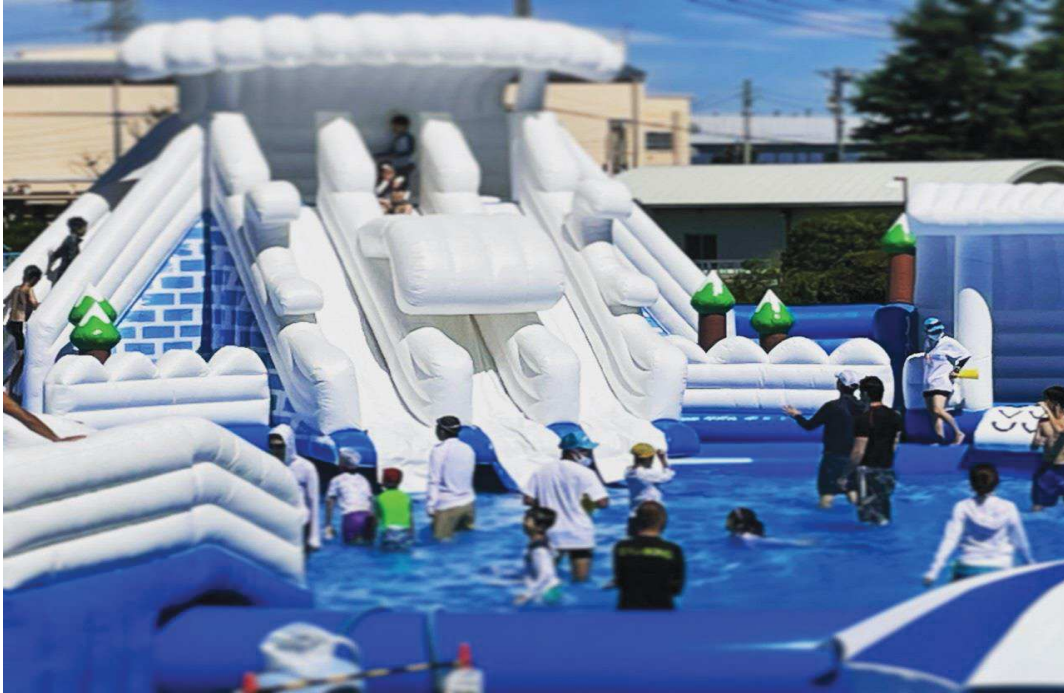
ウォーターアスレチックの様子