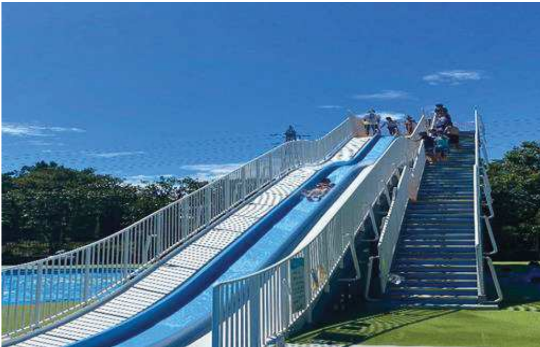
スライダープールの様子