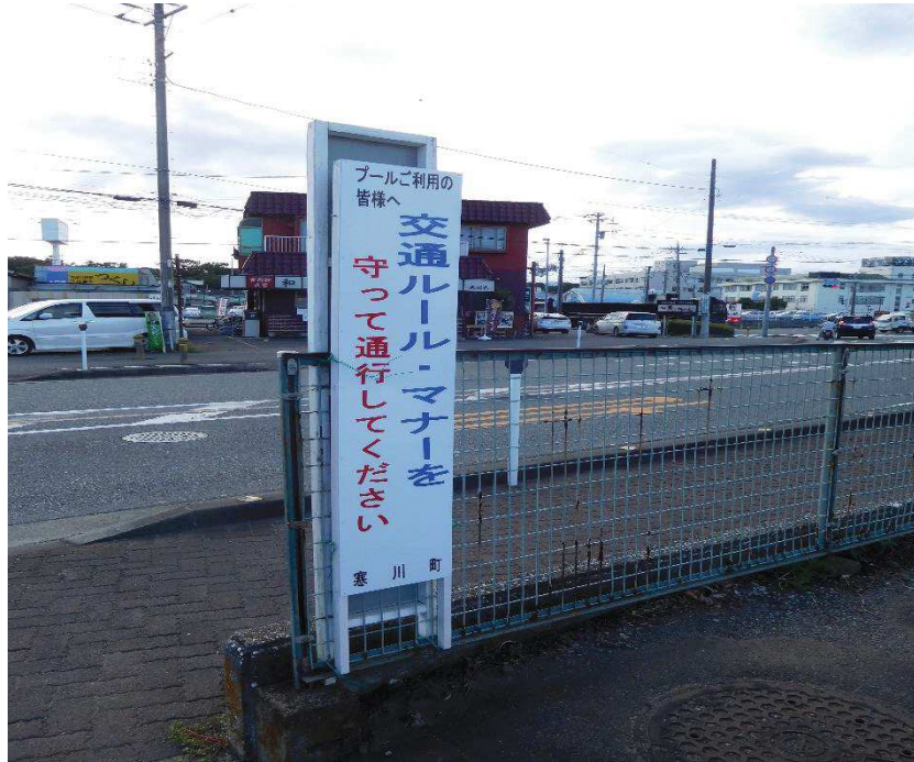
臨時駐車場に設置した看板