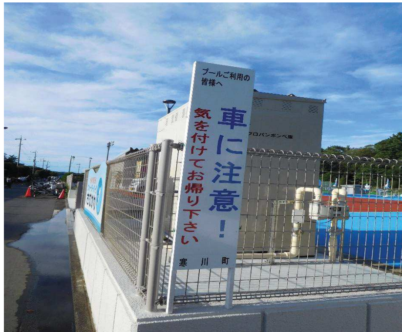
プール利用者への注意看板