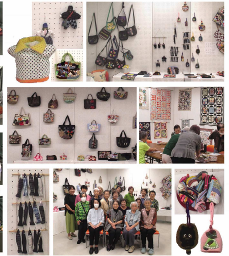
撤収直前の会の皆さんと 壁一面のパッチワーク作品群