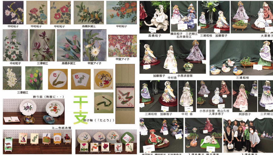
はり絵の多様な作品