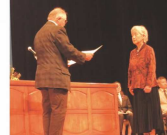
キャッチコピー表彰式