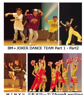
ヤングが舞台狭しと飛び、跳ねる!! BM+JOKER DANCE TEAM Part 1・Part 2 MINX!! 三丸大サーカスfromB.exciting