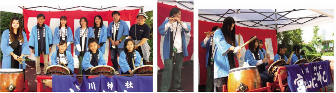
文化の日を盛りあげる、宮山ばやし中里太鼓連のみなさんと演奏の様子。

秋晴れの11月3日、文化の日、今年は「宮山ばやし中里太鼓連」の皆さんの演奏が文化祭の締めとなります。屋外では、婦人会の模擬店、館内では菊花展、盆栽展、呈茶、色紙短冊展、俳句大会が開催中。またホールでは町の表彰式も行われ、演奏は其々の行事の盛り上げに大いに効果をもたらし、文化の日を広く町民へ知らせる手段となっております。