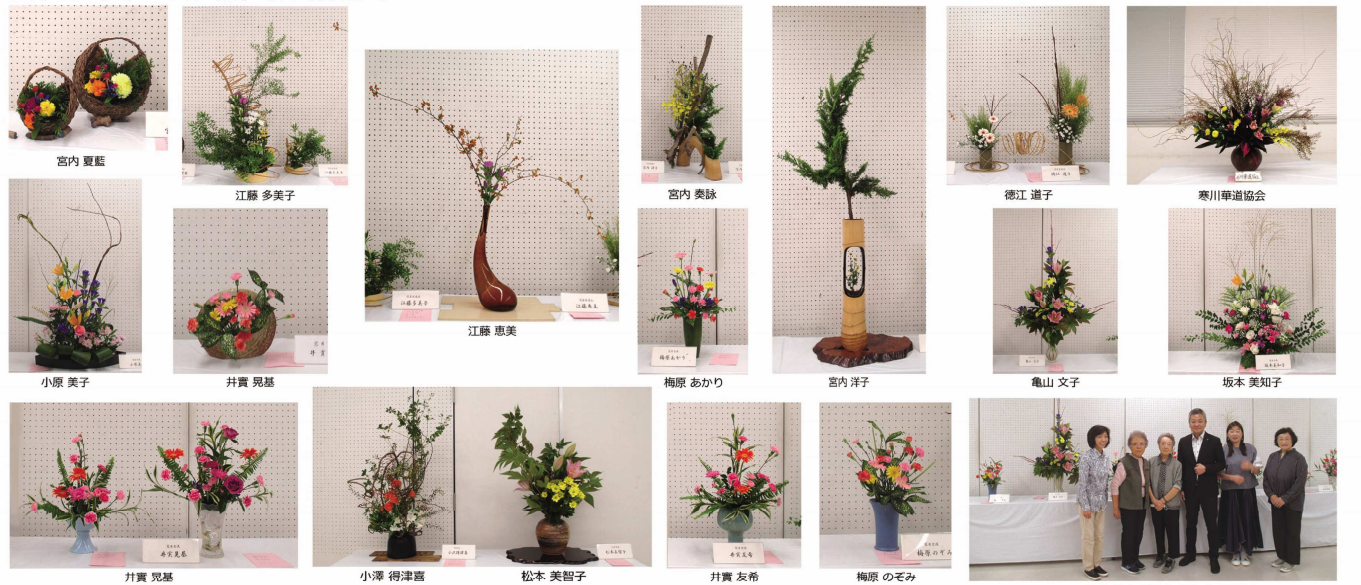
ご来賓と記念撮影