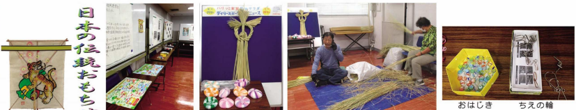
日本の伝統おもちゃ 会場の展示風景 手前は「すころく」 正月飾り 鏡流し 正月飾りの実演 ちはき ちえの輪 おはじき 独楽 折り紙の独楽 かるた ビー玉 とんとん紙すもう 竹とんぼ お手玉 ぶんぶん ゴム鉄砲 万草鏡 毛糸のあやとり 紙ふうせん