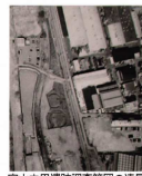
宮山中里遺跡調査範囲の選定

宮山中里遺跡発掘調査報告 さがみ縦貫道関連遺跡（さがみ北インター） ◎遺跡の立地と時代 宮山中里遺跡は相模川の左岸に形成された自然堤防の上に立地しています。本遺跡では平成10（1998）年10月と12月の2度にわたって神奈川県教育委員会が試掘調査を行いました。宮山中里遺跡で発見された古墳は全て墳丘部が削られて消失しており、周溝とよばれる溝の部分しか残っていませんでした。周溝から出てくる遺物の時期は6世紀後半から7世紀初頭で古墳群も概ねその時期に築かれたと考えられます。