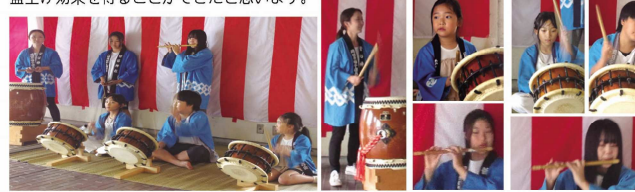
文化祭開催を告げる、心地よい演奏が会場に響く。

文化祭の式典直前の景気づけと、文化祭の始まりを示す大切なイベント。あいにくの小雨模様の中、これからの文化祭の各行事が天気を含め、全ての行事がうまく行きますよう祈りつつ調子の良い音色が寒川の空に響きわたりました。また、当日センター内では「郷土展」「華道展」が開催され、今まで以上の盛り上げ効果を得ることができたと思ひます。