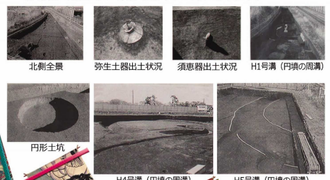
北側全景 弥生土器出土状況 須恵器出土状況 H1号溝（円墳の周溝） 宮山中里遺跡の古墳群 円形土坑 H4号溝（円墳の周溝） H5号溝（円墳の周溝） H12号溝（前方後円墳周溝）