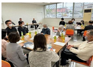
グループごとに懇談