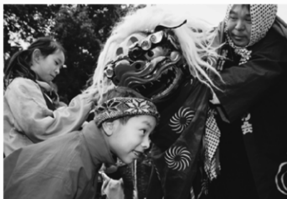
平成17年度の特選作品

※入賞作品の著作権は町観光協会に属します。作品は返却しません。詳しくはお問い合わせください。 〒町観光協会 0466(75) 9051 FAX (72) 1224