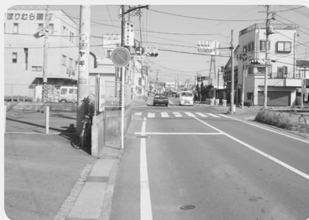
昭和42（1967）年（左）と現在（右）の岡田西交差点（湘南信用金庫前）

昭和40年当時の町の情報が満載された資料「寒川町家屋名入地図」を中心に、町民の皆さんや町の職員が撮影した当時の風景写真、町民の人が収集したマッチの箱絵などを展示し、昭和40年ごろの寒川町の姿にせまります。ぜひお越しください。