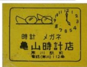
1957年のマッチラベル