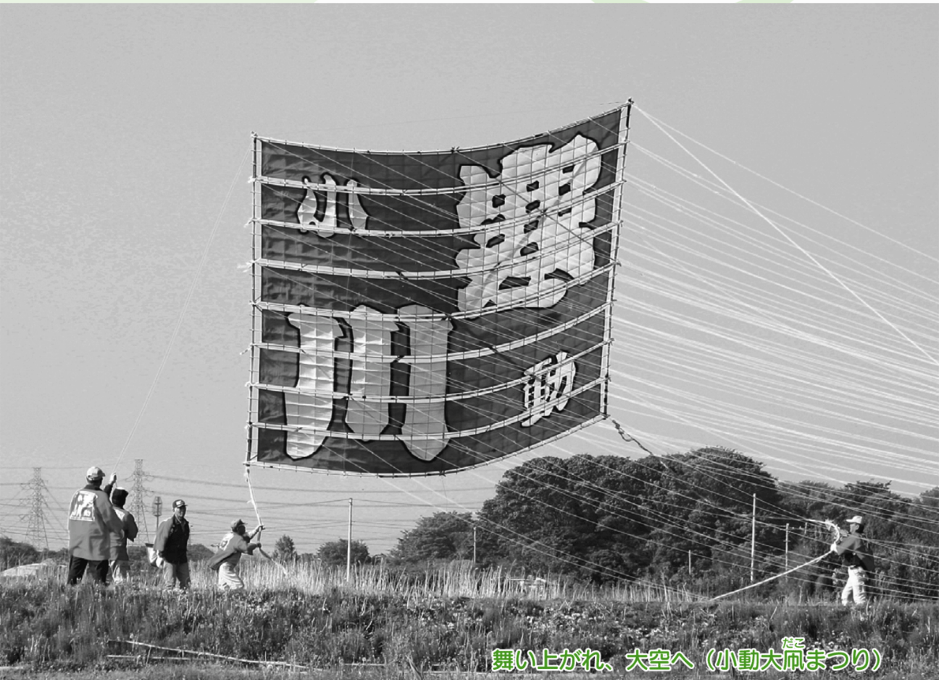
舞い上がれ、大空へ (小動大風 だこ まつり)