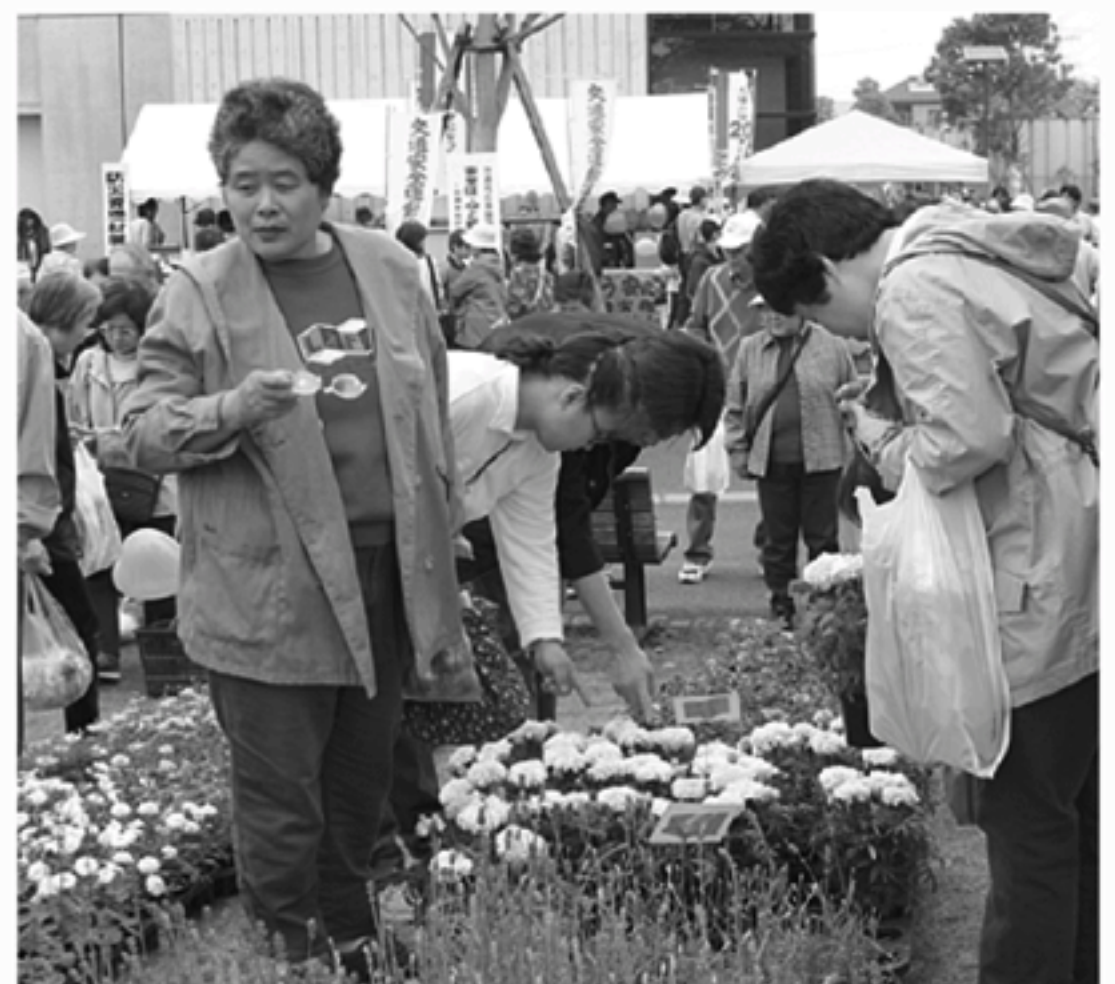
▶会場は色とりどりの花を買い求める人でいっぱい