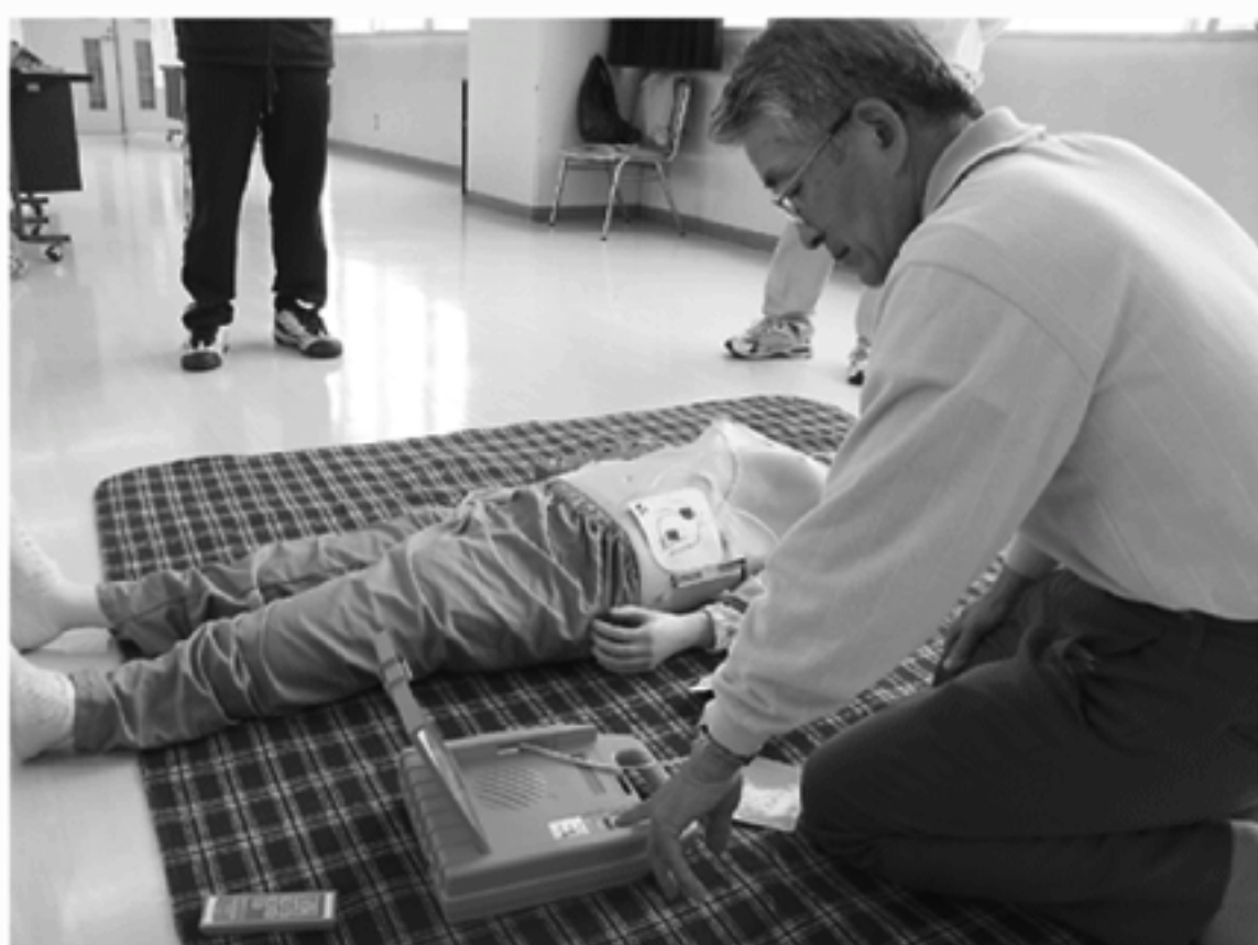
機器の音声メッセージに従い繰り返しAEDの操作を練習する受講者

AED 傷病者の心臓の筋肉がブルブルと震え、全身に血液を送り出すことができないう状態(心室細動)を取り除き心臓のリズムを正常な状態に戻すことを目的とした機器です。起動すると、応急処置をする人がどのよう