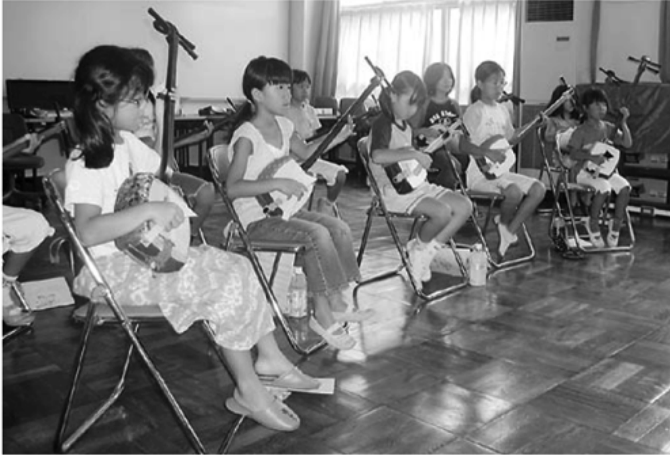
あらゆる人、世代の学習意欲を応援します（写真は町学習情報センターを会場に行われた三味線教室）

ズに対応するために、学習の場の拡大を図る「学ぶ」、学んだことを活動へとつなげ、地域社会の中で「活かす」。