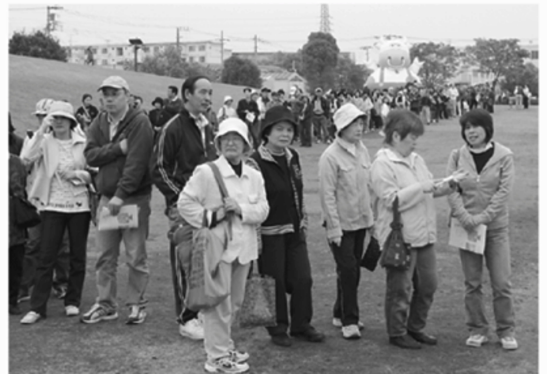
▲花の無料配布には、今年も長蛇の列

四月二十九日、さむかわ緑のフェスティバルが中央公園で開催され、一万三千人の来場者でにぎわいました。毎年恒例になっている花の苗の無料配布には、配布予定の一時も前から列ができました。さまざまな団体による模擬店も出され、ステージでは大道芸や、アマチュアのフラダンス、ヒップホップダンスの披露があり、訪れた人を楽しませていました。 なお会場で集めた緑化のための募金は三万八百三十二円に上り、町の緑化基金への積立とかながわ緑のトラスト財団への募金に送られます。