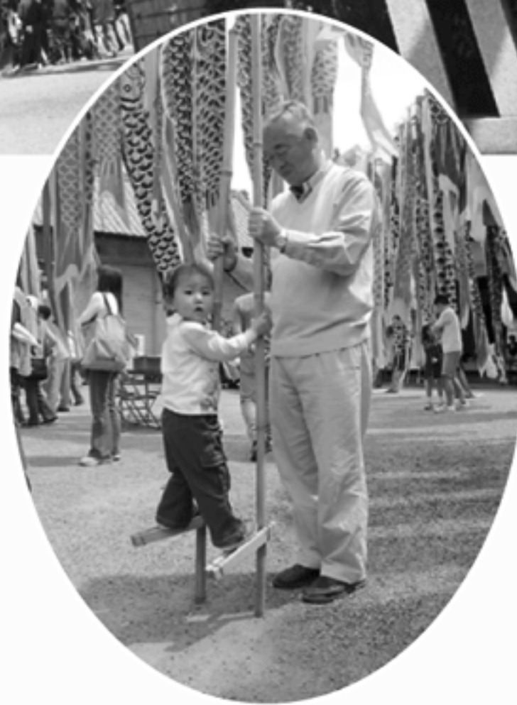
▲竹馬に挑戦中の子ども

四月三十日から五月五日まで一之宮八幡大神の境内に約百六十匹のこいのぼりが泳ぎました。 最終日の五月五日には、神社で子どもたちに遊んでもらおうと企画された子供の目を祝う会が催されました。三百人を越す参加があり、金魚すくい、ヨーヨー釣り、竹馬、竹トンボ、的あてといった昔ながらの遊びをして楽しみました。