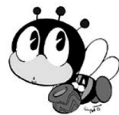
生涯学習のマスコット マナビィ

一人ひとりが個性や能力を発揮し、生きがいのある充実した生活を送るために生涯を通じて行う学習のことです。 家庭、学校、職場での学習や趣味活動、スポーツ、ボランティア活動など、あらゆる分野で行われます。