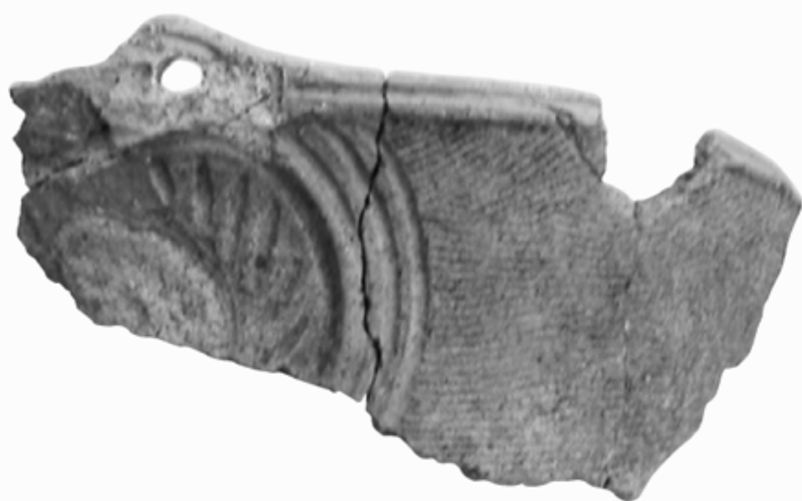
縄文時代後期の堀之内式土器の破片

生涯学習課 ☎ (74) 1111 内線 523 生涯学習担当 (文化財学習センター) FAX (75) 9907