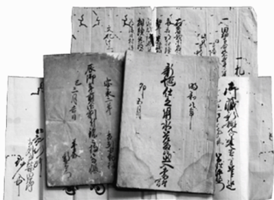
江戸時代の生活の様子などが記された古文書