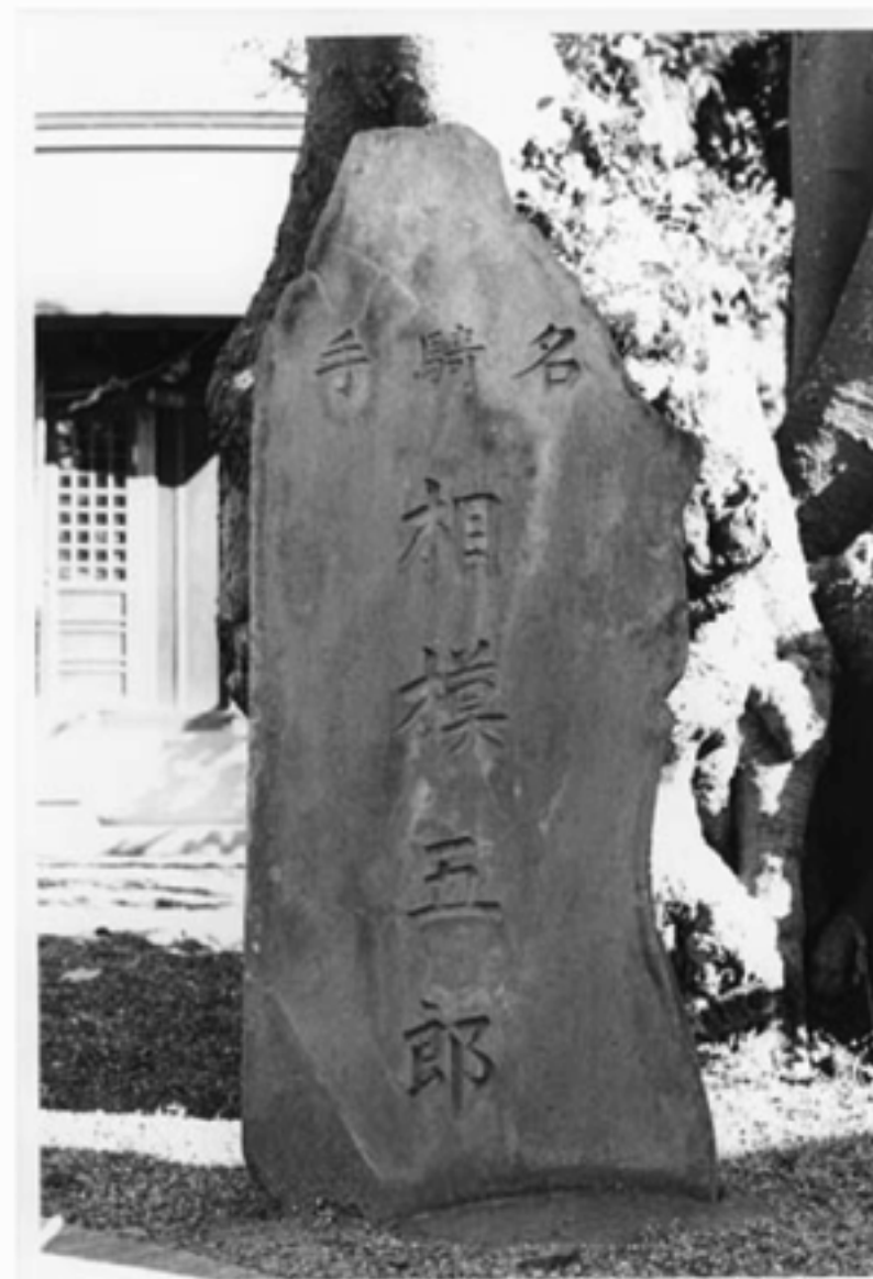
倉見の水神宮に建つ相模五郎の碑 後は水神宮の社殿

企画課 ☎ (74) 1111 内線 411 町史編さん担当 FAX (74) 9141