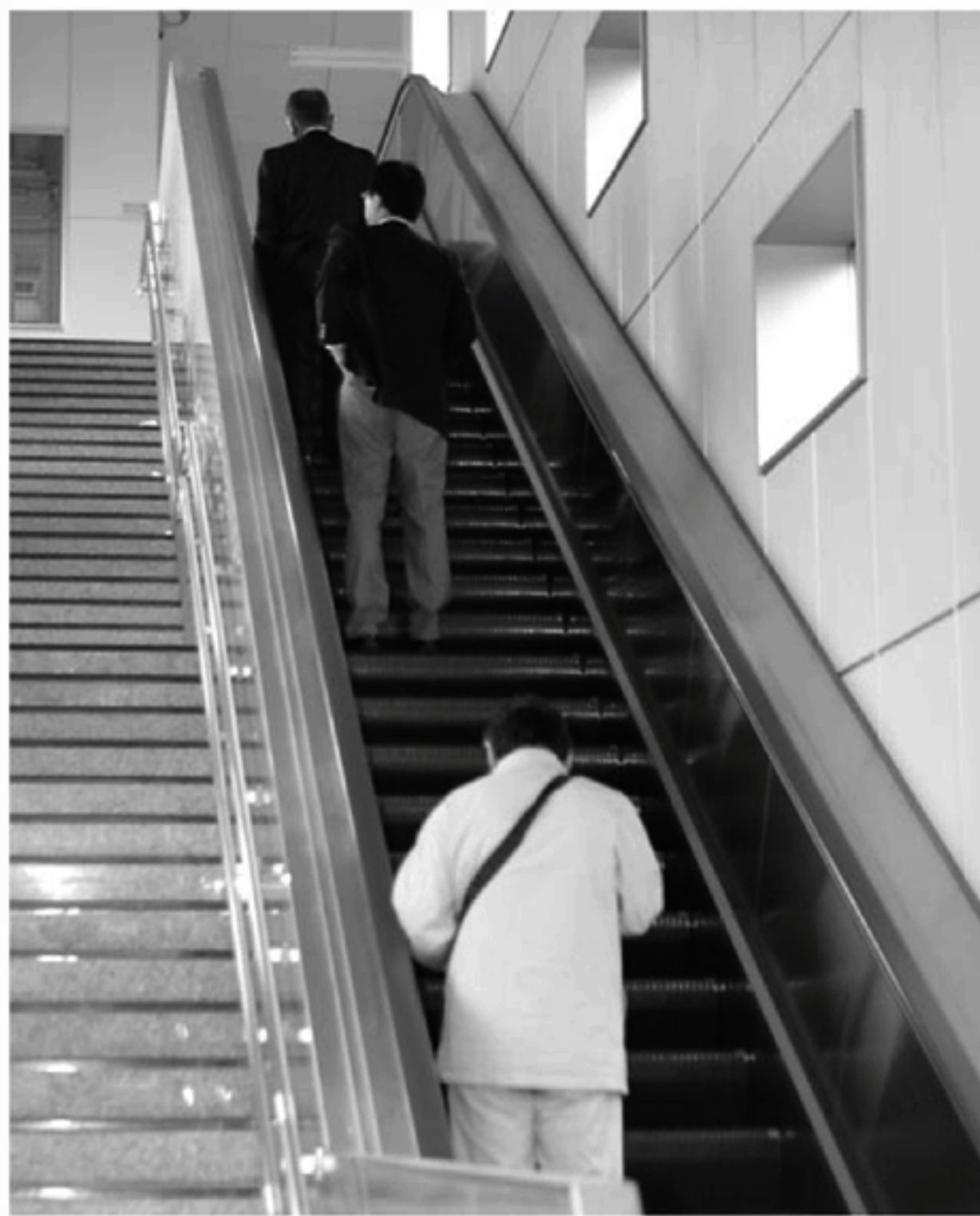
JR寒川駅南口東側に設置されたエスカレーター

J R寒川駅南口は駅前を通る町道に歩道を整備するため、駅の階段を一部撤去する必要がありました。そのため撤去工事とあわせてバリアフリー化と利便性の向上のため、エレベーターとエスカレーターを設置し、現在運転中です。エレベーターは相模線の運行時間にあわせ、朝は始発から、夜は終電まで運転しています。エスカレーターは上り用のみで、利用者が近づく