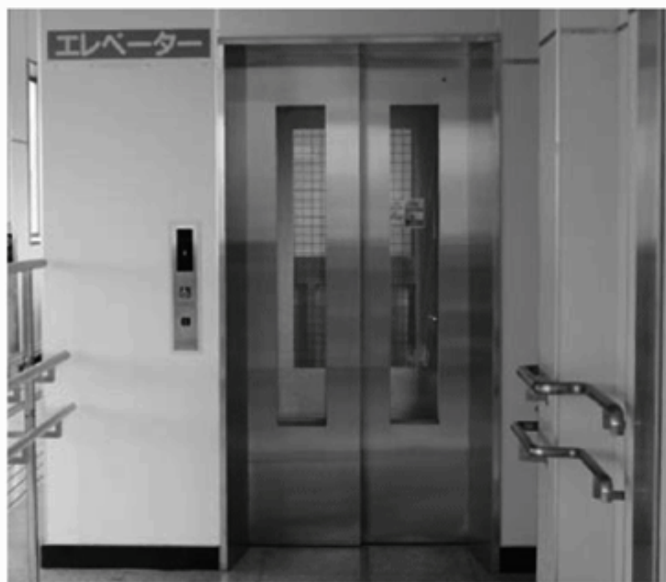
エレベーターは南口階段の中央部にあります