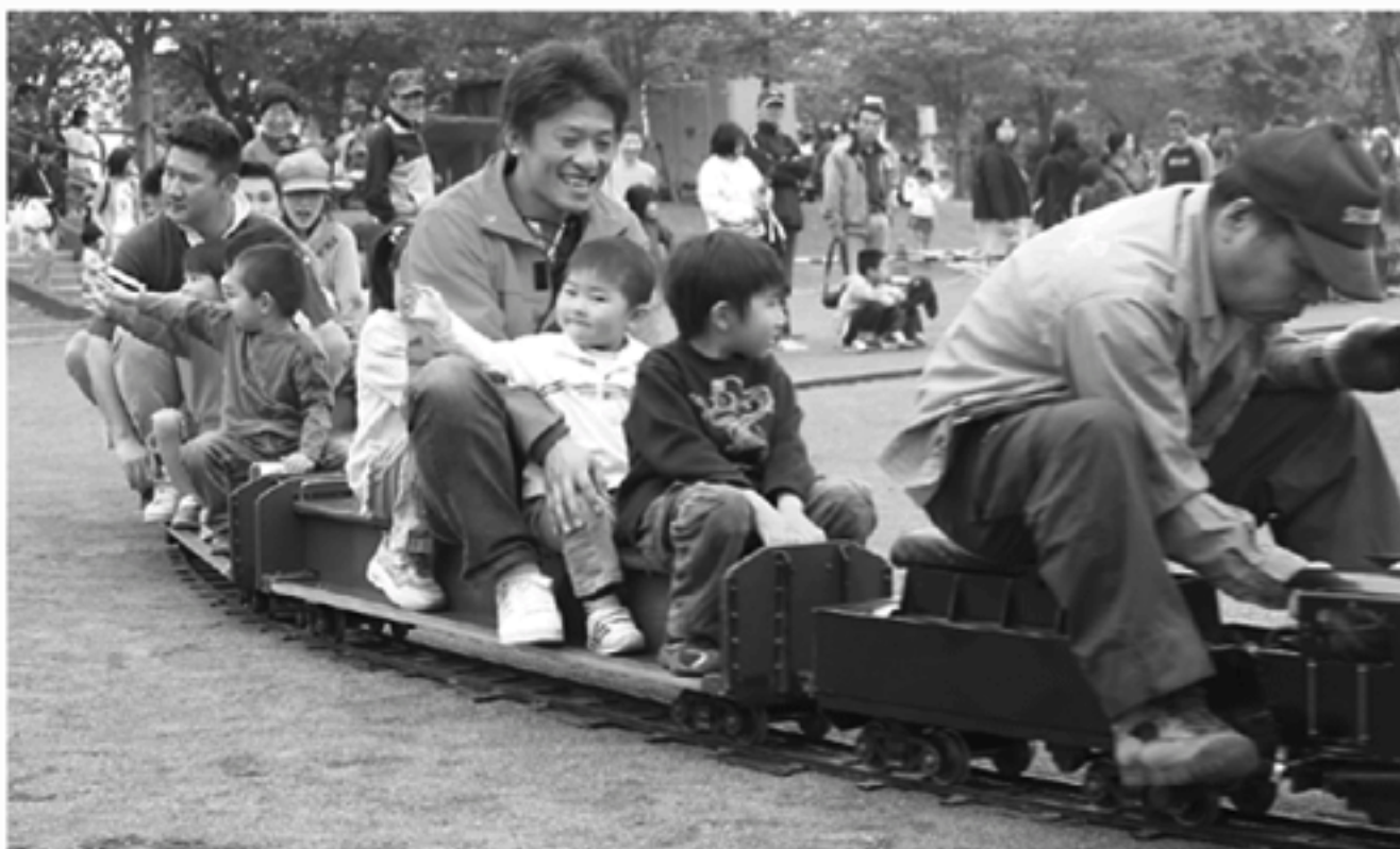
▲ミニSLは子どもたちに大人気