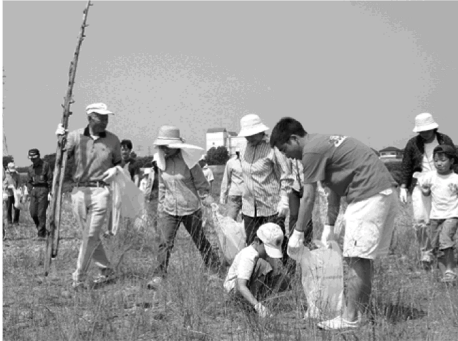
去年の美化キャンペーンの様子

関東地方では、毎年五月三十日（ゴミゼロの日）を環境美化運動（ゴミゼロの日）を展開しています。これにあわせて、町でも相模川河川敷の清掃の日と定め、統一美化キャンペーンを実施します。