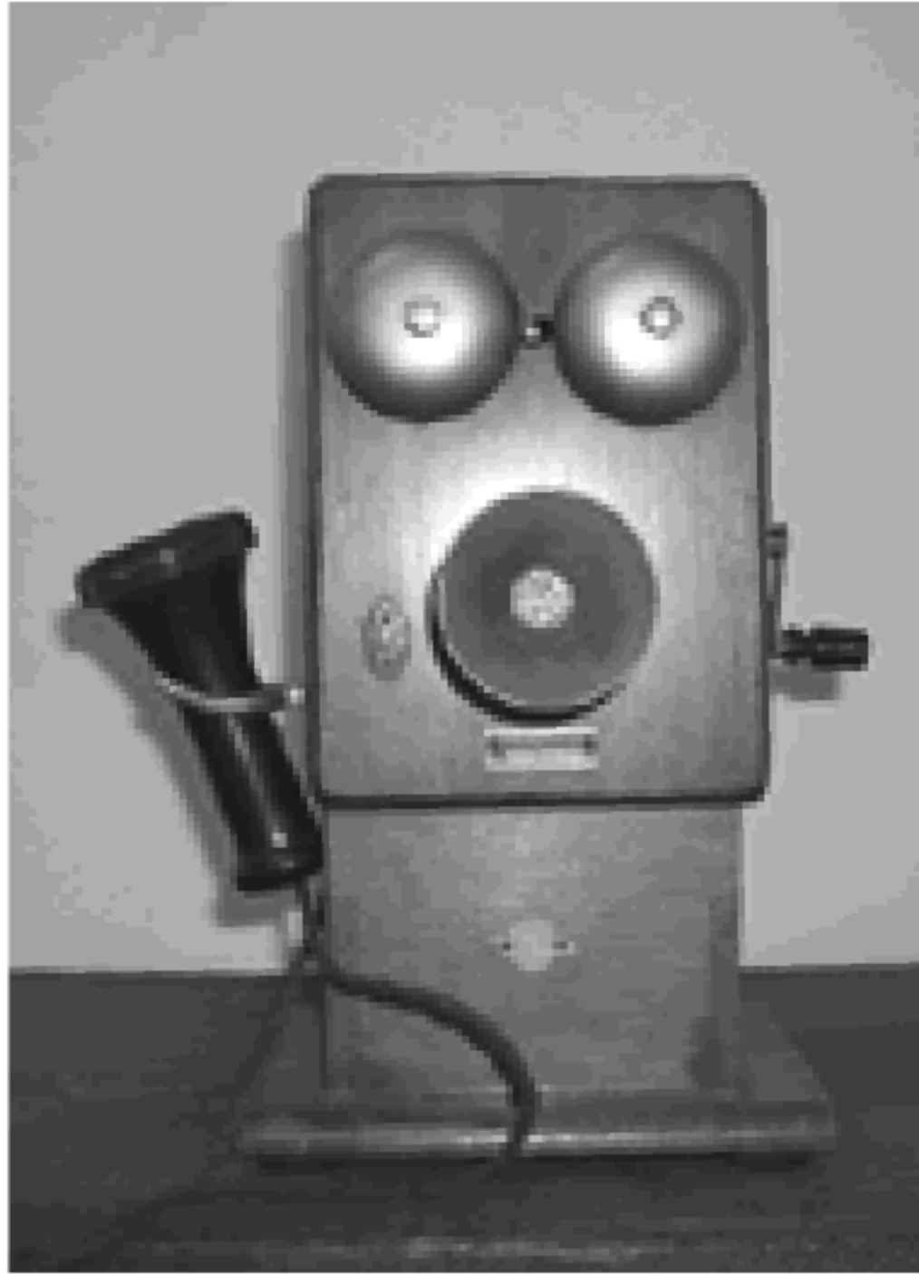
デルビル磁石式壁掛電話機

ジリジリ電話、磁石式電話などと呼ばれていた写真の電話機は、正式にはデルビル磁石式壁掛電話機といえます。この電話機は、明治二十九年に登場し、長い間全国的に使われていたので、記憶のある人も多いと思います。使い方は、現在の自動式と異なり、電話交換手を呼び出すために、箱の右側についている発電機のハンドルを回し交換台の表示板に合図を送る仕組みになっていました。