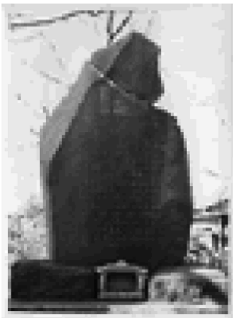
大（応）神塚発掘記念碑