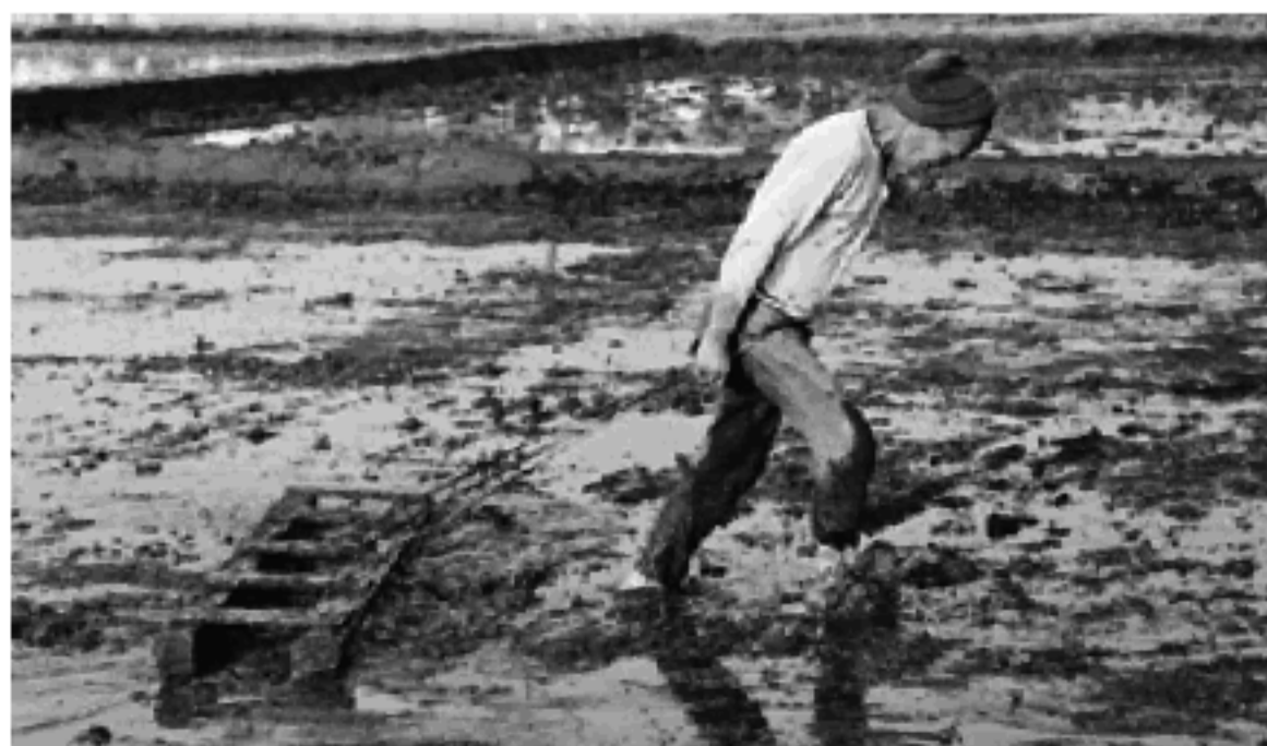
代掻馬鋤で整えている様子

☎ 生涯学習課 (74) 1111 内線 523 生涯学習担当 FAX (75) 9907