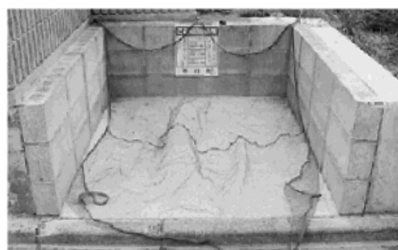
収集場所のカラスネット

代わりにブルーシートやコンテナボックスでカラス対策をしている地域の皆さんは、特に不燃ごみの回収日には気をつけてください。可燃ごみと不燃ごみの回収作業員は違いますので、ごみとして回収されてしまうとお返しできません。回収されないようにわかりやすく表示してください。ご協力をお願いします。