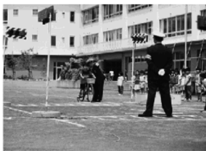
子ども交通安全教室