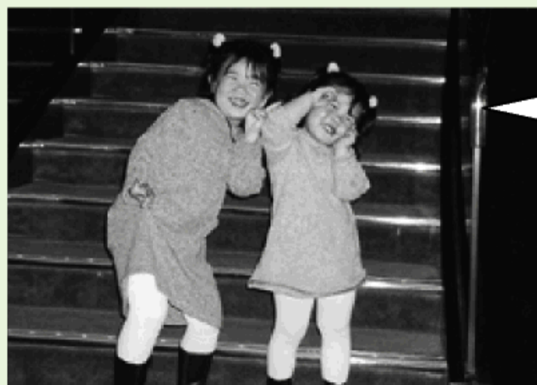
姉妹で、はいポーズ

おじいちゃんやおばあちゃんと孫、一家の写真なども募集しています。ペットと一緒にの写真もどしどし応募してね。