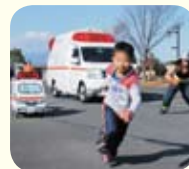
解答権をめぐって消防署員と競走

それは式典後の救急車の適正利用に関するPRで、消防署員が名(迷?)演技のショートコントで119番通報を再現し、子どもたちが適正かどうか答えるというものでした。