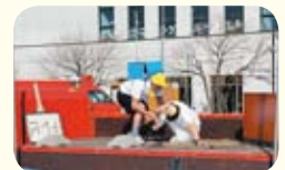
119番通報を再現する消防職員

1月8日、さむかわ中央公園で町消防出初式を開催しましたが、意外なアクションに感心しました。