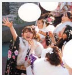
環境に配慮した風船を飛ばす新成人

式典後、「新成人から盛り上げていこう」という意気込みと今年のテーマ「昇」にちなみ風船を飛ばしました。