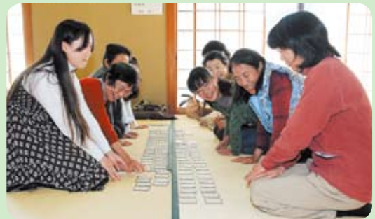
源平合戦を楽しんでいる様子

会場では、かるたという伝統的な遊びを通じて、さまざまな世代の人が交流していました。