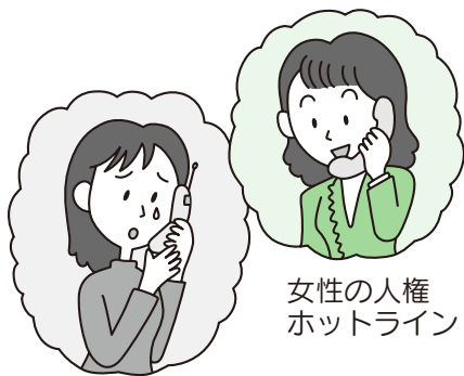
女性の人権ホットライン