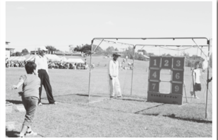
いくつ的を倒せるかな