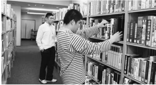
本を整理する二人

ろなことを経験したい」と作業が終わった二人は、汗にまみれながら、笑顔で語ってくれました。