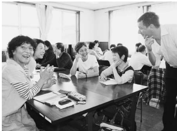
講師との会話を楽しむ参加者