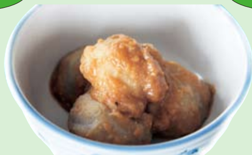
里芋とみそは相性抜群。