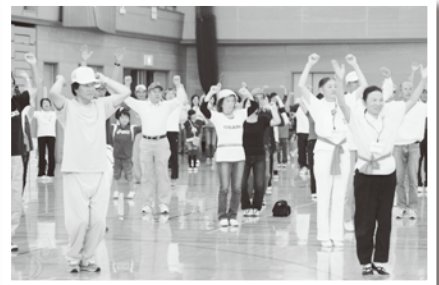
準備運動はさむかわwakuwaku体操