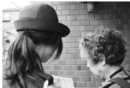
交通事故防止を呼びかける女性警察官

自転車に乗るときは、安全に十分注意をして、夕方や夜間などは夜光反射材となるものをつけるようアドバースをしていました。