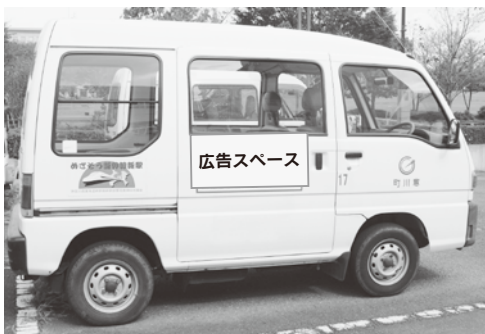
広告料収入の拡充（公用車側面広告）