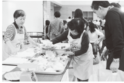
野菜の分量、分かりますか