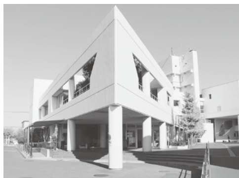
各事業の見直しを行います