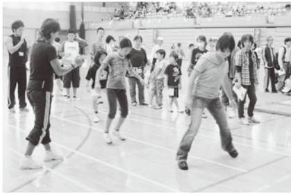
自分の体力はどのくらい

さむかわ中央公園では各種模擬店が立ち並び、広場でペタンクやグラウンドゴルフなどのレクリエーションを行いました。