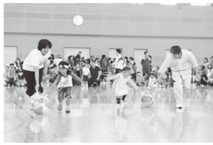
親子で協力して次の人にバトンタッチ