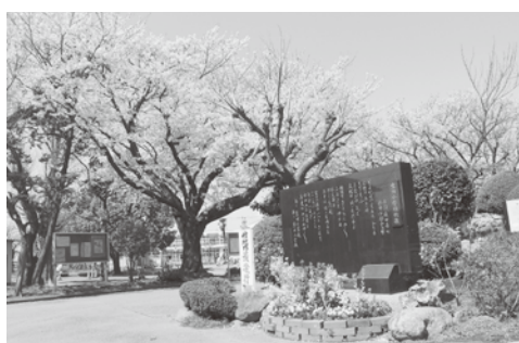
新しい生活がスタートします