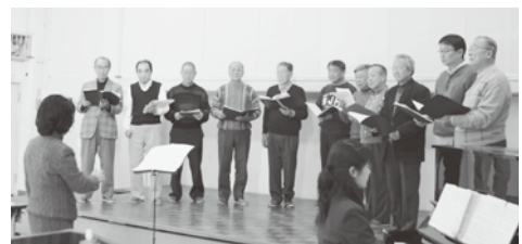
ハーモニーの楽しさを味わっています

わたしたちは毎月第一・三土曜日の午後一時から四時三十分まで南部文化福祉会館で活動しています。