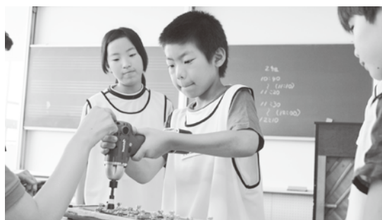
小学校では楽しいことがいっぱい

早寝早起き、朝食、用便など毎日の生活習慣をしっかりと身につけさせ、衣服の着脱と後片付けが一人で行えるようにしておきましょう。小学生になると行動範囲が広がるため、交通事故や不審者による被害な