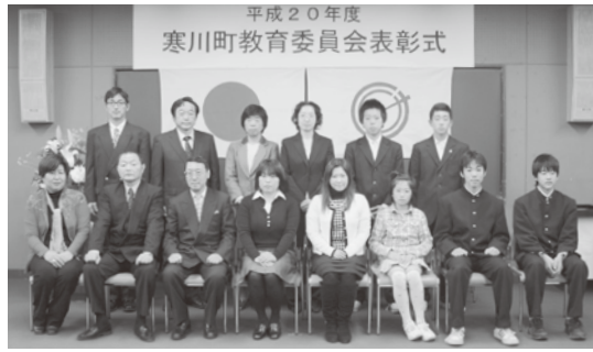
被表彰者の皆さん

二月十日、町教育委員会表彰式を町民センターで開催しました。これは町の教育や文化、スポーツの振興に貢献した人の功績をたたえるもので、今年は十七人を表彰しました。