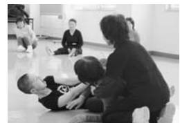
就寝中の護身術を実演

驚かせたり、手をつかまれたら大きな声を出したりするなど、具体的な状況下でのようにしたら自分が逃げることもできるのかを、実技を交えて学んでいました。