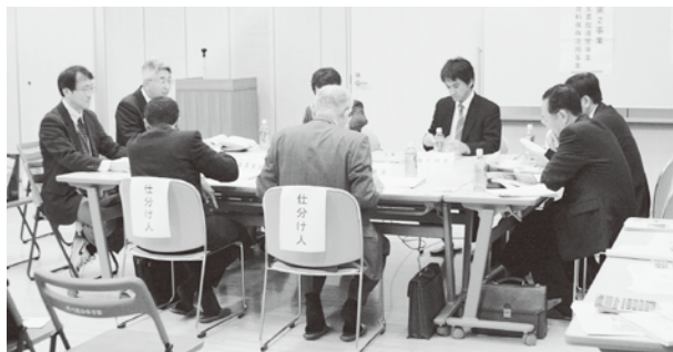
事業仕分けの様子

か」といった視点で、事業のありかたそのものを外部の視点を取り入れて考え直す制度のことです。