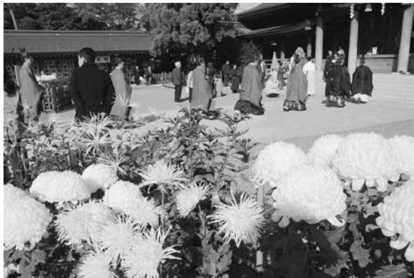
観光の部 特選「秋の境内」 柳森康さんの作品