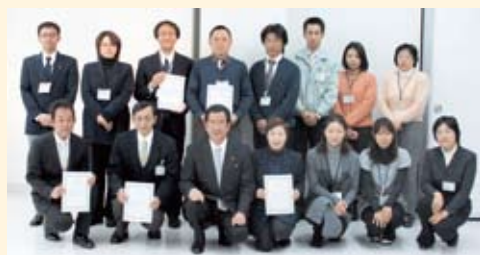
表彰を受けた担当職員

今回の予算編成で初めて導入したインセンティブ(提案の評価)予算要求。行政サービスの質を落とさず歳出削減に取り組むなど、今まで以上に創意工夫をこらした予算要求を行った担当に対し、わたしが評価し、年末の仕事納め式にインセンティブ予算要求認定書を4課5担当に授与し、表彰しました。