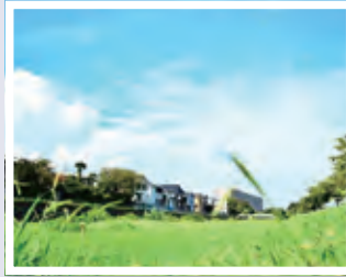
のどかな景色@目久尻川 (geokazuさん)

このコーナーでは、皆さんに「#さむかわい」を付けて投稿していただいた写真の紹介をしています。