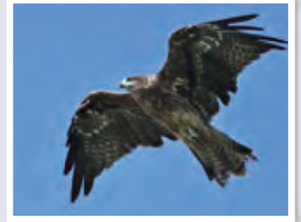
青空を飛ぶ鳥@川とのふれあい公園