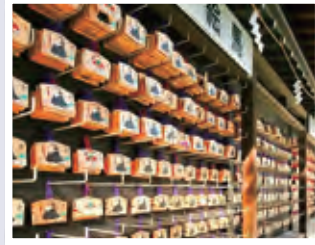
絵馬@寒川神社 (tsuru.powerspotさん)