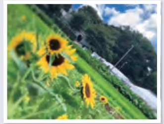
ひまわり咲く頃@小動 (shioironysさん)