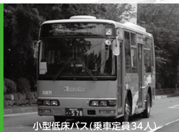
小型低床バス(乗車定員34人)