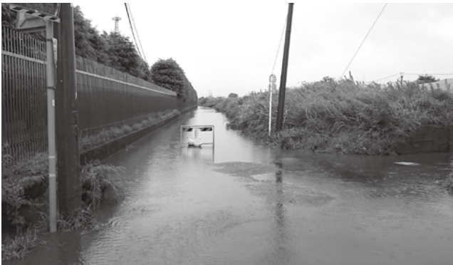
道路冠水により一時通行止めを行った寒川浄水場東側道路の様子