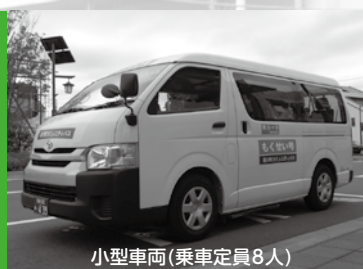
小型車両(乗車定員8人)