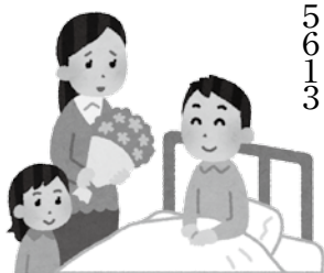
小災害見舞金制度