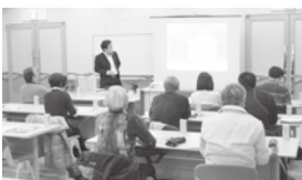
▲各地区でも好評の少人数勉強会

【日時】10/10(土) 午前10時~(約1時間半) 【場所】寒川総合体育館3階会議室