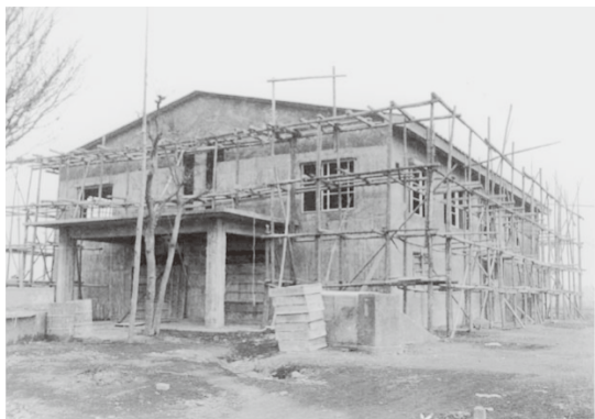
建設中の公民館（昭和34年撮影）