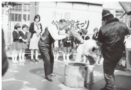
第1回公民館まつり（昭和54年撮影）

寒川町公民館は、昭和35（1960）年2月に開館して以来、ちょうど50年にわたって、講座・サークル活動・図書館運営などといった、寒川の生涯学習の拠点であり続けましたが、この3月で休館することになりました。