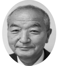
教育長の思うところ

また、これから梅雨の時期を迎えますが、この時期は気温や天候の変化が激しく、心も体も影響を受けやすくなります。少し早めに寝るなど、体調管理に気を付けて過ごし、楽しい学校生活を送ってください。