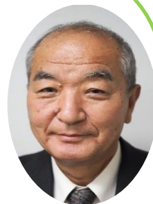
教育長の思うところ

さて、小学生・中学生の皆さん、もうすぐ冬休みですね。皆さんにとって、今年はどうな年だったでしょうか。今年を振り返るとともに、これから迎える新しい年をより良いものにするための準備をできるところから始めていきましょう。小さな工夫や努力の積み重ねが、願い事や夢を実現するための大きな力になります。一つずつ、一歩ずつ日々の活動を大切に、前に進んでいきましょう。一歩前進を目指し、来年も笑顔で楽しい学校生活を送ってください。