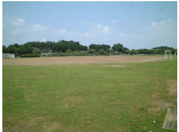
川とのふれあい公園サッカー場

所在地 寒川町宮山 4331 番地 敷地面積 32,910.00 m 2 利用可能種目 軟式野球、ソフトボール、サッカー