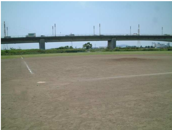
川とのふれあい公園野球場