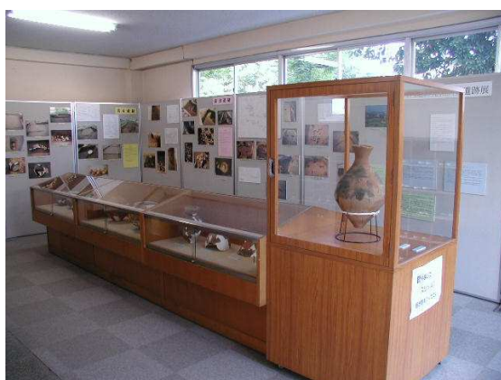
埋蔵文化財展示コーナー

町立一之宮小学校内にある「文化財学習センター」では、土器、民具、歴史資料等の文化財を通して寒川の歴史が学べます。