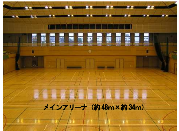
メインアリーナ(約48m×約34m)

所在地 寒川町宮山275番地 電話 0467(75)1005 敷地面積 10,025.75 m 2 施設概要 メインアリーナ、サブアリーナ、武道場、弓道場 トレーニングルーム、浴室、サウナ室、多目的室、会議室等