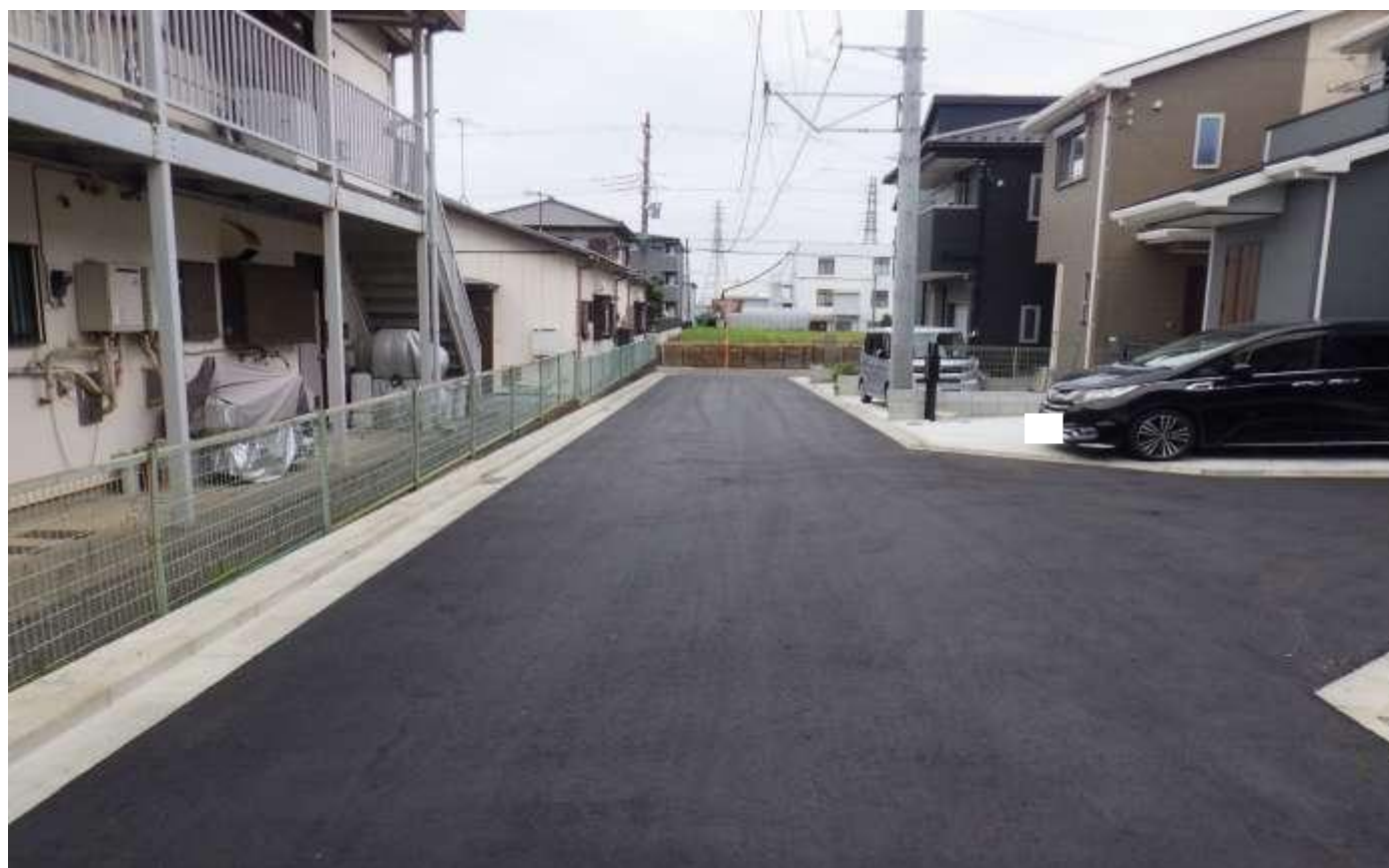
04046 大曲 46 号線 現況写真 【終点→起点】