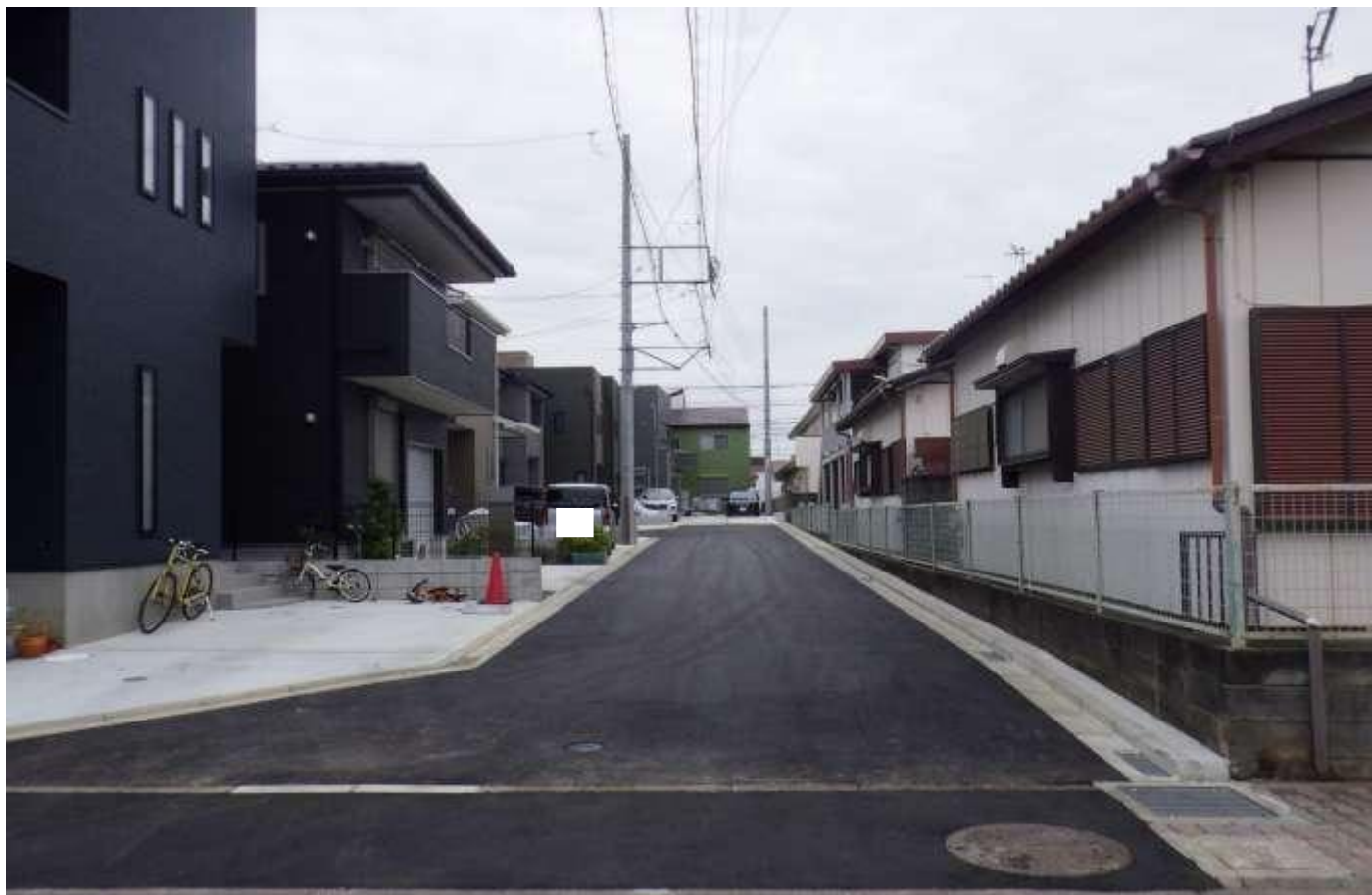
04046 大曲 46 号線 現況写真 【起点→終点】