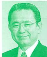
衆議院議員 (自由民主党) 田中和徳氏