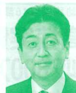
衆議院議員 (自由民主党) 星野剛士氏