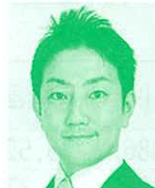
衆議院議員 (立憲民主党) 中谷一馬氏