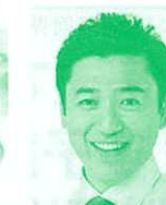
参議院議員 (公明党) 三浦信祐氏