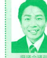
県議会議員 (日本共産党) 上野達也氏