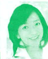
参議院議員 (立憲民主党) 牧山弘恵氏