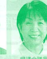
県議会議員 (日本共産党) 石田和子氏