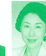
衆議院議員 (立憲民主党) 早稲田夕季氏