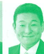
衆議院議員 (立憲民主党) 笠浩史氏