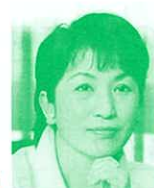
参議院議員 (社会民主党) 福島瑞穂氏