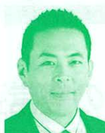
衆議院議員 (立憲民主党) 篠原 豪氏