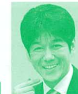
衆議院議員 (立憲民主党) 義家弘介氏