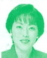
参議院議員 (日本共産党) 田村智子氏