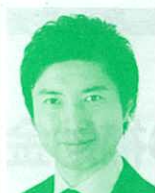
衆議院議員 (立憲民主党) 青柳陽一郎氏