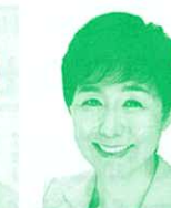
参議院議員 (立憲民主党) 水野素子氏