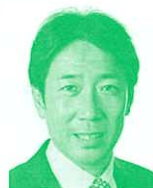
衆議院議員 (自由民主党) 中山展宏氏