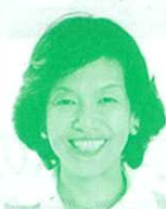
衆議院議員 (立憲民主党) 阿部知子氏