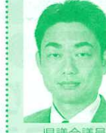
県議会議員 (日本共産党) 井坂新哉氏