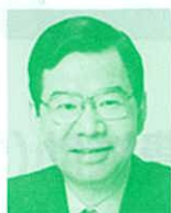
衆議院議員 (日本共産党) 志位和夫氏