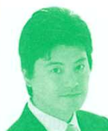
衆議院議員 (自由民主党) 三谷英弘氏