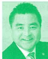
衆議院議員 (立憲民主党) 太 栄志氏