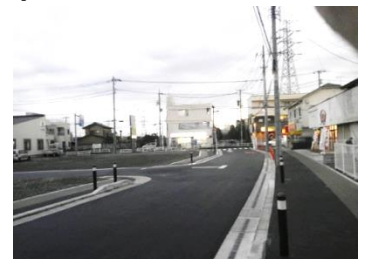
(車道と歩道が整備)