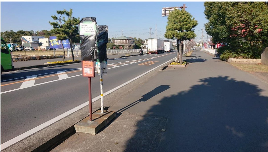
バス停③ 寒川神社参道