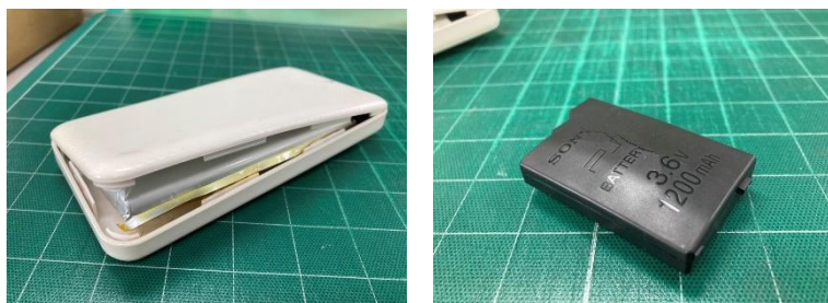
▲破損、膨張してしまったモバイルバッテリー、充電電池

破損、膨張などしているモバイルバッテリー、充電電池は、衝撃等により発熱・発火の危険性があるため、大変危険です (※小型家電回収ボックスに投函しないでください!!)