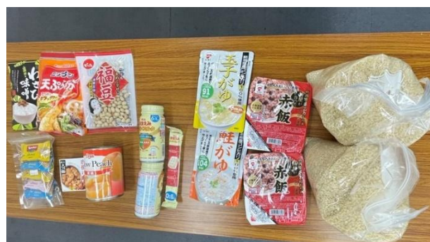
▲お米やレトルト食品等を寄附いただきました。