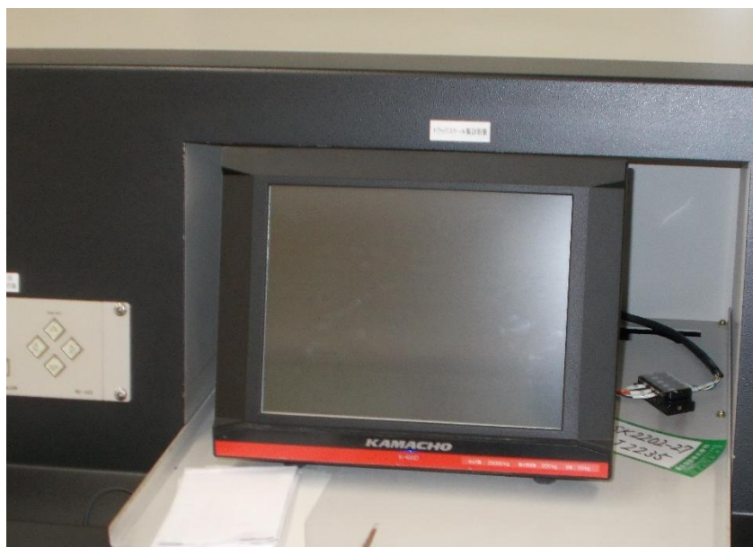
トラックスケール データ処理装置