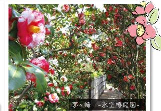
茅ヶ崎 -氷室橋底園-