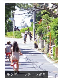
茅ヶ崎 -ラチェン通り-