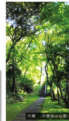
大磯 -大磯城山公園-