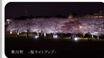
寒川町 -桜ライトアップ-