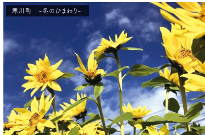
寒川町 -冬のひまわり-