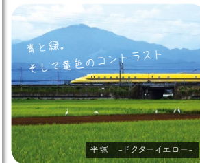
青と緑。そして黄色のコントラスト