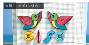
大磯 -デザイン灯台-