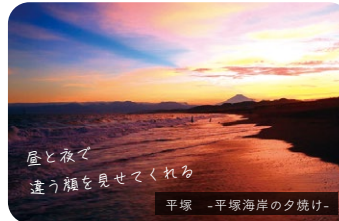
屋と夜で 違う顔を見せてくれる