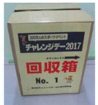
回収箱のイメージ