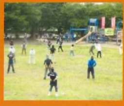
町長と一緒にラジオ体操