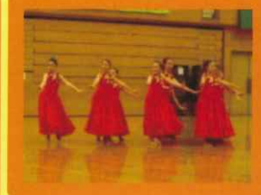
ダンスフェスティバル