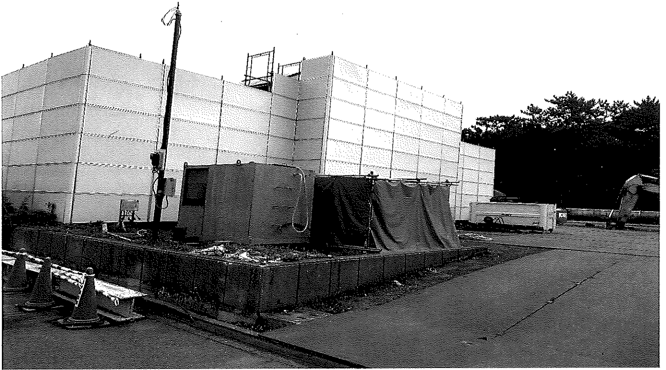
屋内 25m プール