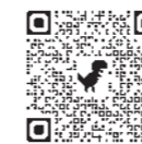
電子申請はこちら