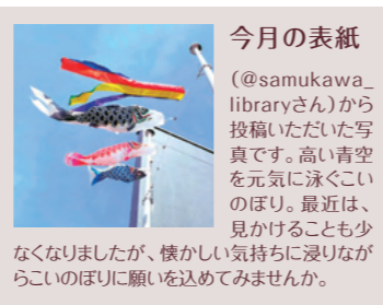
今月の表紙 (@samukawa_libraryさん)から投稿いただいた写真です。高い青空を元気に泳ぐこいのほり。最近は見かけることも少なくなりましたが、懐かしい気持ちに浸りながらこいのほりに願いを込めてみませんか。