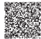
電子申請はこちら

❶開催日前日までに同課へ電話か直接、電子申請、ファクスまたはEメール(町ホームページから)の場合は氏名、住所、電話番号、参加希望講座名を記入して送信