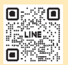
Stretch&Gym Wish 公式LINE