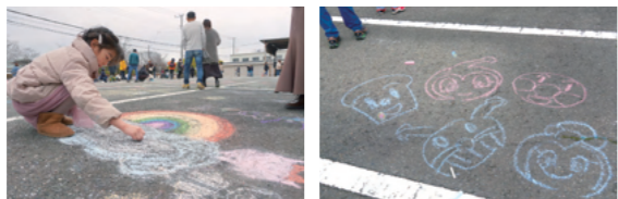
「チョーク祭り」 3/20に開催されたチョーク祭り。あいにくの天気でしたが、たくさん家族連れが集まり、役場駐車場がカラフルな絵で彩られました。子どもたちの笑顔が弾けるイベントとなりました。

このコーナーでは、皆さんに「#さむかわい」を付けて投稿していただいた写真や町が撮影した写真の紹介をしています。