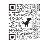
②の電子申請はこちら