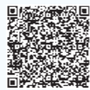
電子申請はこちら

町と提携している事業所(タクシー券送付時に同封されるチラシに記載)のみ利用可能です。利用料金の500円を超えた部分は自己負担となります。