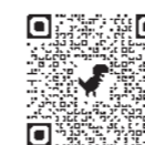
①の電子申請はこちら

☑ ①5月5日(火)～6月5日(金)②5月5日(火)～6月19日(金)に電子申請で ※両日程応募可。