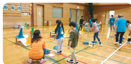
電子申請はこちら

wakuwaku体操、ゲーム(わなげ、おはじきうつし、魚つりなど) 持 飲み物、タオル、室内用シューズ、靴を入れる袋、動きやすい服装で(スカート不可) 日 6月2日(火)までに電子申請で ※子ども会経由で申し込む場合、個人での申し込みは不要です。 ※当日のボランティアを募集します。希望者は同課までご連絡ください。 ※保護者の見学も可。