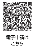
電子申請はこちら

❶同課へ電話が直接、はがき、ファクスの場合は氏名、生年月日、住所、電話番号を記入して郵送か送信、または電子申請で