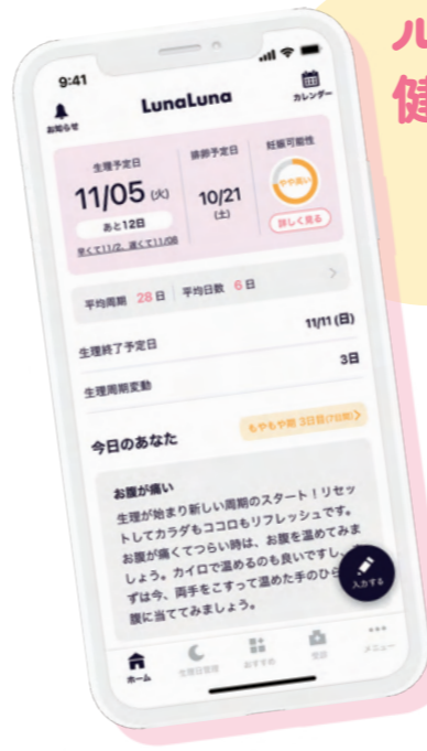
ホーム画面(イメージ)

町内に住んでいる人は、町特設ページより下記の専用コードを入力することで、通常有料となるルナルナのプレミアムコースを令和10年3月31日まで無料で利用できます。妊娠を望む人の妊活サポート機能をはじめ、健康管理に大切な基礎体温や生理周期の記録にも役立つアプリです。ぜひご活用ください。