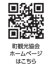
町観光協会ホームページはこちら