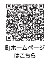
町ホームページはこちら

☎ 町内在住か在勤または在学の人 ※種目や申し込み方法等については町ホームページをご確認ください。