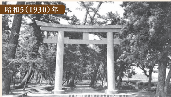
寒川神社一之鳥居(「相模国一之宮国幣中社寒川神社 絵はがき(昭和6年刊)」)(写真①)

大正12(1923)年の関東大震災で倒壊した鳥居は、相模鉄道(株)の奉納により再建され、その後改修工事を経て現在も同じ場所に立っています。