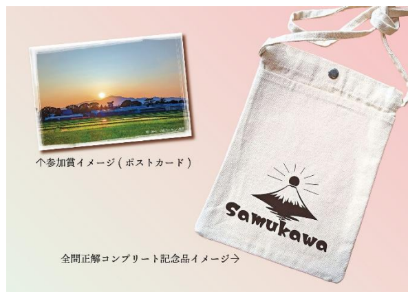
1 人参加賞イメージ (ポストカード)