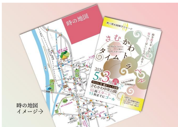
時の地図 イメージ→