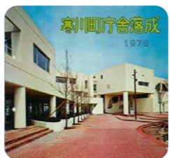
役場庁舎落成のパンフレット(昭和51(1976)年)

今年の干支は辰です。これまでの辰年にはどのような出来事があったのでしょうか。文書館で保管しているさまざまな資料をパネル