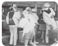
給食の準備(昭和38(1963)年)

寒川学校給食センターがオープンしました。寒川の小学校で給食が始まった昭和33(1958)年ごろの様子を示す史料や写真をパネルにして展示します。