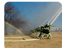
昨年の出初式の様子

年頭にあたり、消防団員の士気の高揚と職務遂行への決意を新たにするとともに、防火・防災の意識と啓発を目的として消防出初式を開催します。消防団コーナーでは防火衣の試着ができるほか、先着でプレゼントも用意しています。消防団員による緊迫した出動の演技や豪快な一斉放水をお楽しみください。