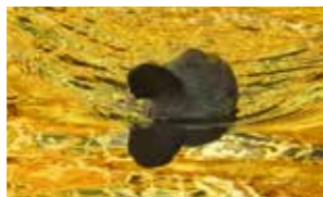
「目久尻川とオオバン」(@mirai0308さん) 年明けの目久尻川を泳ぐ一羽のオオバン。光り輝く水面が神秘的ですね。

このコーナーでは、皆さんに「#さむかわい」を付けて投稿していただいた写真や町が撮影した写真の紹介をしています。