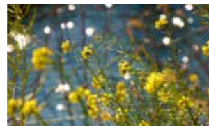
「水面と花」(@opal.th2さん) 新年となり、「今年初めて見る花」がこんなに美しいと気持ちが上がりますね。