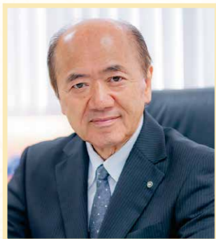
寒川町長 木村俊雄