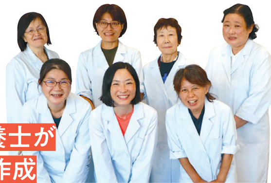
センターの栄養士