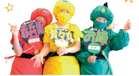
三食忍者の衣装をまとったセンターの調理員

子どもたちがおいしそうに給食を食べている笑顔を見ることがやっぱり一番うれしいですね。子どもたちの「おいしい」を目指して調理員、栄養士が一丸となって、毎日腕を振っています。