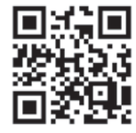
公民館ホームページ