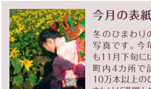
今月の表紙 冬のひまわりの写真です。今年も11月下旬には町内4カ所です計10万本以上のひまわりが満開となります。また、11月23日～26日には摘み取りイベントを開催します。詳しくは、町観光協会ホームページをご覧ください。