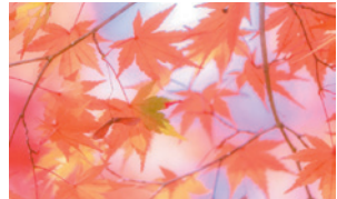
「真っ赤に色づいた美しい紅葉」(@sweet_touch_candy1990さん) 涼しい風を感じながら、色鮮やかな景色を楽しみましょう。今年もすてきな紅葉狩りができるといいですね。

さむかわいっ♪ 写真展 Instagram このコーナーでは、皆さんに「#さむかわい」を付けて投稿していただいた写真や町が撮影した写真の紹介をしています。