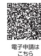
電子申請はこちら

☎町民窓口課 ☎内線474 相談・人権担当 【ページID】14089 📅12月19日(火)、22日(金)、令和6年1月12日(金)のいずれか いずれも午後1時30分～4時 所 町民センター 人 各回20人(先着順) 講 ソフトバンク認定講師 ほか ※1人につき、スマートフォン(AndroidまたはiPhone)1台を貸し出します。 📝11月13日(月)から同課へ電話か直接、または電子申請で