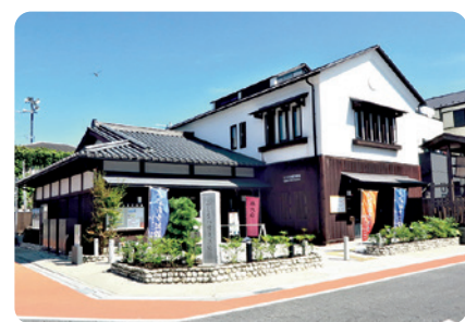
ふじさわ宿交流館

藤沢御殿跡を含む旧藤沢宿の一角には、「藤沢市ふじさわ宿交流館」があり、藤沢宿に関する歴史を学べる資料が展示されています。ぜひ訪れてみませんか。