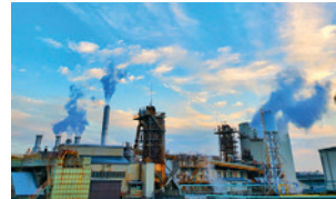
「朝の工場」(@mirai0308さん) 朝の青空に見る工場の姿は、夜景とは異なる彩りを添えてとても魅力的です。新たな町の魅力がまた一つ見つかりました。