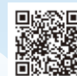
図書館ホームページ