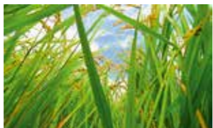
「稲と青い空」(@coca_kohgaさん) 実った稲の間から見える広く美しい青空。田んぼに住む生き物たちは、いつもこんなにきれいな景色を見ていたんですね。

このコーナーでは、皆さんに「#さむかわい」を付けて投稿していただいた写真や町が撮影した写真の紹介をしています。