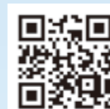
公民館ホームページ