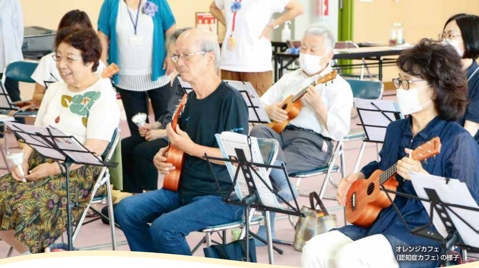
オレンジカフェ (認知症カフェ)の様子