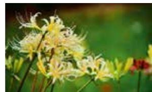
「白のヒガンバナ」(@seiji.fujihiraさん) 白いヒガンバナの花言葉は「また会う日を楽しみに」。夏の思い出を忘れない思いがこもっているようで、素敵ですね。