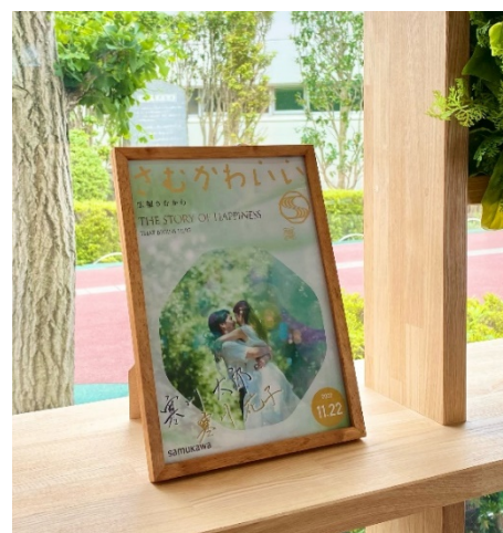
飾ったときのイメージ

この町独自の取り組みは、今この瞬間をステキな思い出にしてもらいたいという想いを込めています。