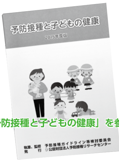
「予防接種と子どもの健康」を参考に！