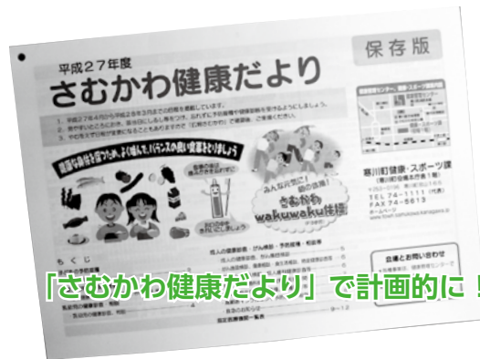
「さむかわ健康だより」で計画的に！