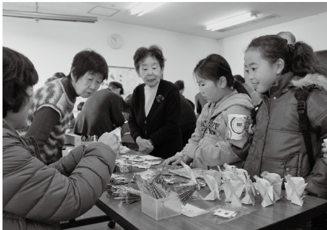
昨年の公民館まつりの様子

話は変わりますが、寒川駅前公園に放送設備が完成しました。今後は、イベント会場として多くの方に活用していただければと思ひます。