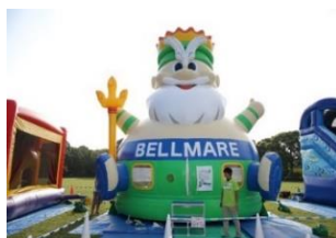
キングベルふわふわ