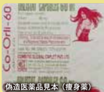
偽造医薬品見本（瘦身薬）

医薬品や医療機器の個人輸入には、粗悪品や偽造品を購入するリスクがあります。インターネット上で「海外製医薬品」と称し販売されている製品を分析した結果、表示と異なる成分を含む製品も見つかり、これらを使用すると重大な健康被害が起こるおそれがあります。