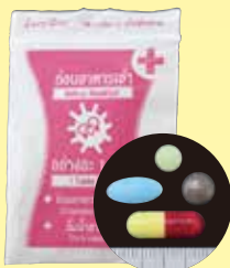
ホスピタルダイエット製品

「ホスピタルダイエット」「MDクリニックダイエット」などと称される製品から医薬品成分が検出され、死亡（疑い）事例を含む健康被害が複数報告されています。2019年にはインターネットで台湾のダイエット製品を個人輸入し、服用した20代の女性が、吐き気、全身倦怠、動悸、胸痛の症状により医療機関を受診。服用していたダイエット製品（7種類のカプセル及び錠剤）から医薬品成分が検出されました。