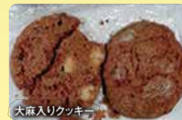
大麻入りクッキー

海外旅行のお土産として買ったり、もらったりしたクッキーやチョコレート等の中に大麻が含まれているものもあります。また、電子タバコの中に液体状の大麻を入れて密輸する例も相次いでいます。これらは全て「大麻」であり、日本に持ち込むこと、人にあげること、持っていることは違法です。「これぐらいなら…」ではすまされない“犯罪”になるので、十分に注意してください。