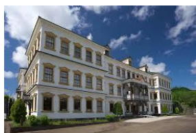
国指定重要文化財 小坂鉱山事務所