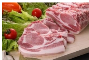
十和田湖高原ポーク 桃豚