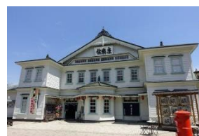
国重要文化財 明治の芝居小屋 康楽館