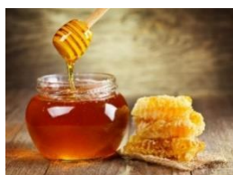
最高級アカシア蜂蜜