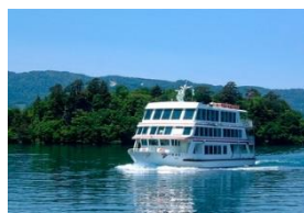
特別名勝及び天然記念物 十和田湖