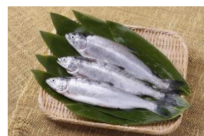
十和田湖ヒメマス