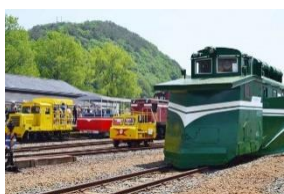
小坂鉄道レールパーク