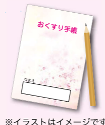
※イラストはイメージです

2011年3月11日に発生した東日本大震災の津波で流されたお薬手帳が発見されました。手帳の持ち主が自ら拾い、避難所の薬剤師に提示したことで、使用している薬が分かり、すぐに対応することができました。