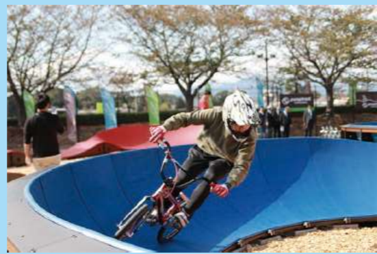
samukawa パンプトラックさむかわ