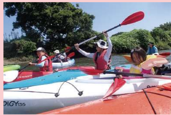
samukawa 相模川カヌー体験