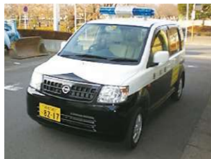
青色回転灯装備車

小・中学校の下课時間に合わせて青色回転灯を付けた青パトが通学路を巡回しています。何かあれば青パトに大きな身振りで助けを求めよう、お子さんに話してください。