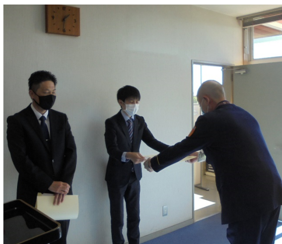
消防長より感謝状を贈呈