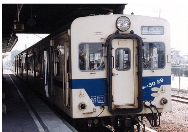
平成3年 電化直前の寒川駅