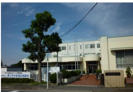
健康管理センターの3階です

「シニアげんきポイント」へのお問い合わせは、寒川町社会福祉協議会ボランティアセンターでお受けしています。